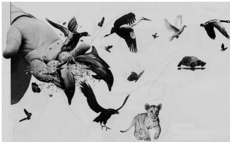
A mão do Criador: Ele está acima de nós?

Redija um texto DISSERTATIVO que aborde o seguinte tema: